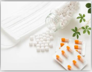
新薬の方がお勧めです

③眠気の副作用…鼻水は止まったけど眠くて仕事にならん！ということでは困ります。眠気の出方は同じ薬でも体調によつて全然違います。近所のおばちゃんから「この薬眠くならへんで」と言われても信じないようには！ とにかく、色々試してみるのが大事！昔からある薬より、新しく出た薬の方が、効き目・副作用の少なさ伴に改善されています。