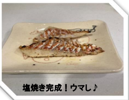
塩焼き完成！ウマシ♪