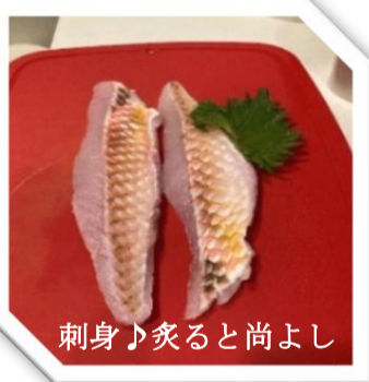
刺身♪炙ると尚よし