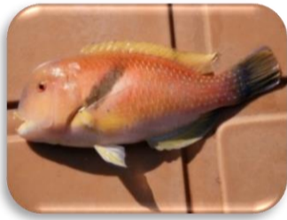
イラ…何かカワイイ☆

イラという魚をご存じですか？スズキ目ベラ科に属する魚です。生息地は本州中部以南の沿岸のやや深い岩礁域に生よく潜んでいるんです。 この魚ですが、巨大ベラっぽい御三家(私が勝手に呼んでいるんですが…)。他の御三家はコブダイ、ブダイ！で、めっちゃ美味しいんです！