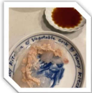
肝と和えた薄造りはたまない♪

最後にこした肝を、捌いて薄造りにしたカワハギの身に和えて、醤油で頂く…「世界一美味しい！」と言ってしまいたい☆