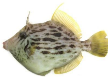
愛しいカワハギちゃん☆

かわい顔したカワハギちゃん♡フグ目、カワハギ科、カワハギ属です☆結構近場でも釣れるし、魚屋さんでも安く売っている、身近な魚です。肉は白身で、焼き物、唐揚げ、冬は鍋とどんな料理にも合うんです！ さて、このカワハギちゃんを今回は、薄造りの、お刺身に☆ まずは、ツノと口先ヒレを落として、口先から一気に皮を剥ぎます。ツルツルと剥けて気持ちがいいんです。 そして頭を落として、内臓に達しないように上の部分だけ切口