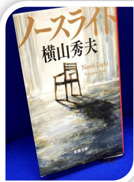
ノースライト=北からの採光