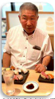
ありがとうございます！おじい様！