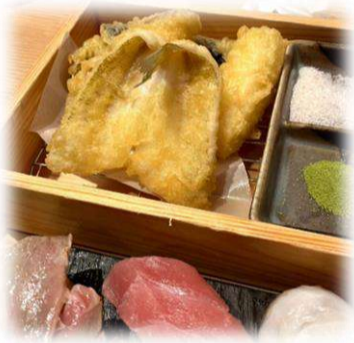
ランチもリーズナブルで食べ応えあり☆