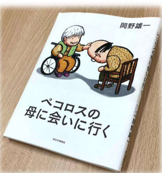
笑えて、温かくて、どこか切ないコミックエッセイ...