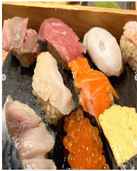
メニューが豊富☆お酒も肴も楽しめちゃう♪