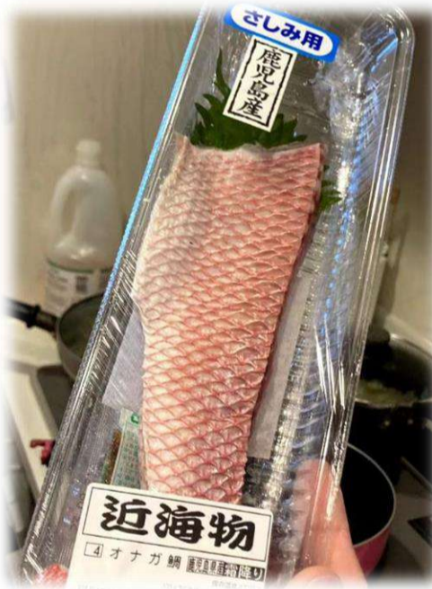
塩焼きのために購入した刺身用のオナガダイ！ 調理した写真を撮り忘れました…(泣)

皮の質と硬さ、皮下 脂肪の量と味、身の絶 妙な水分量。全てがち ょうどいい！！ さしみ用の皮つき切