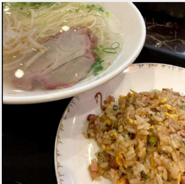
お上品なラーメンと美味しいチャーハンとセットでいただきました☆