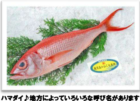
ハマダイ地方によっていろいろな呼び名があります！

塩焼きにて！ 個人的に、魚の塩焼 きの中で「オナガダイ」 の塩焼きが、一番好き です！