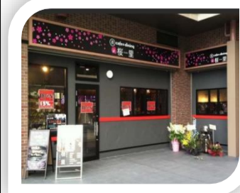
阪神尼崎駅南側よりすぐ☆

阪神尼崎駅から南へ走って1分!「茶カフェ&ダイニング桜里(おうり)」。老舗のお茶屋が経営しており、ランチ・ディナーと営業しており、今回はランチをいただきました。 早速「カツサンド」を注文!ザクザクのカツにデミグラスソースをつけて、食パンに挟む、日本一のカツサンド!(私はそう思っております☆)。日本に2人しかいない、女性日本茶鑑定士監修の、日本一のお茶!(これも私はそう思ってます)仕事中には飲めませんが、抹茶ビールも最高!(抹茶焼酎もあります)何を頂いても美味しい☆特にお茶は最高です! 「茶カフェ&ダイニング桜里」 尼崎市御園町5-4 1階 営業時間 10時30分~24時00分 (ラストオーダー 23時00分) ☎06-4869-4108 定休日 日曜