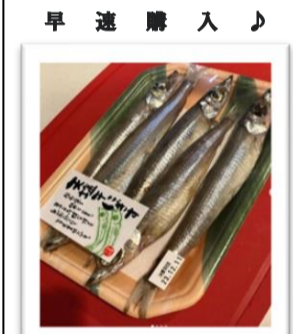
脂は多いものもクセのない上質な白身☆

■ニギスはどんな魚? ニギス目ニギス科の深海魚で、大きな目に突き出した下あごが特徴です。 ■食べてみたかった! 昔から存在は知っていましたが、ついに手を出す日が:笑。 ボウズこんにやくさんの「おいしいマイナ―魚図鑑」によると、干物は単純に焼いておいしい、しかしフライはもつとおいしいかも: