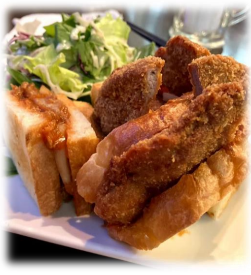
ランチで頂くカツサンド カツと茶の相性抜群!

【中馬病院周辺グルメ】 茶カフェ&ダイニング 桜里 ▼緑茶の魅力と料理のマッチングに感動☆